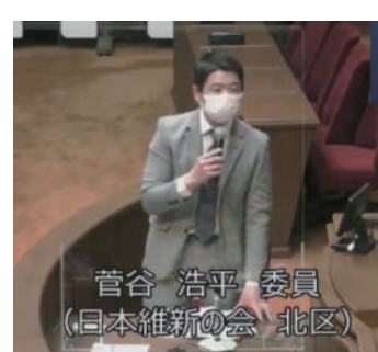
▲2月議会で市野外活動施設の無駄な予算について指摘する

京都市教育委員会は8月10日、市野外活動施設の奥志摩みさきの家などを2022年度末に前倒して廃止する方針を示した。市教育委員会は、コロナ禍で少なくなるとも2023年度末まで奥志摩みさきの家の利用者受け入れを中止する一方で、年間約2千万円以上の管理費を無駄に払い続けていた。わたしは今年の2月議会で、市に対して是正を求めていた。