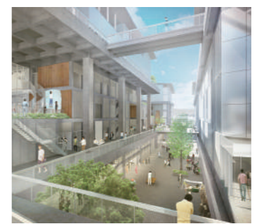
▲10月に開校予定の下京区・市立芸術大学の新たなキャンパス

京都市11月議会は昨年の12月12日に最終本会議を開き、物価高対策など27億6500万円を増額する2022年度一般会計補正予算案のほか、市の143施設の指定管理者を指定する議案や、マイナンバーカードによる証明書のコンビニ交付手数料を引き下げる条例改正案、市路上喫煙禁止条例で1000円の過料を徴収する区域の名称を「対策強化区域」に変更する条例改正案など、市が提出した計138議案を可決・同意した。地域政党京都党・日本維新の会市議団は、市が今年の10月に下京区への移転・開校を目指す市立芸術大学などの工事費を総額約296億円まで増額する工事請負契約の議案には反対した。