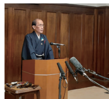
▲市役所の組織運営に問題があったことを認める門川京都市長

市の内部調査によると、計18人の市職員らが食事や物品の提供を受けていたことが判明。なかには、同園を監査で訪れた際に園側から昼食に3000円程度する仕出し弁当の提供を受けたり、靴下・ハンカチや1万円程度するボールペンなどを受領したりしていた。市は市倫理条例の違反者や当時の監督者など計18人の市職員らを懲戒やけん責などの処分にした。