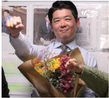
▲バンザイではなくガンバローで3期目に向けての決意を誓う

4月9日の京都市議会議員選挙の投開票の結果、わたしは北区で9663票の得票をいただき、初のトップ当選で3選を果たすことができました。前回、前々回と僅差での勝利から一転、維新に対する期待の高さを感じる結果となりました。また、前回の選挙で議席を減らした自民党が2議席を獲得した一方で、56年ぶりに共産党が2議席から1議席に減らすなど、今回も波乱の選挙となりました。